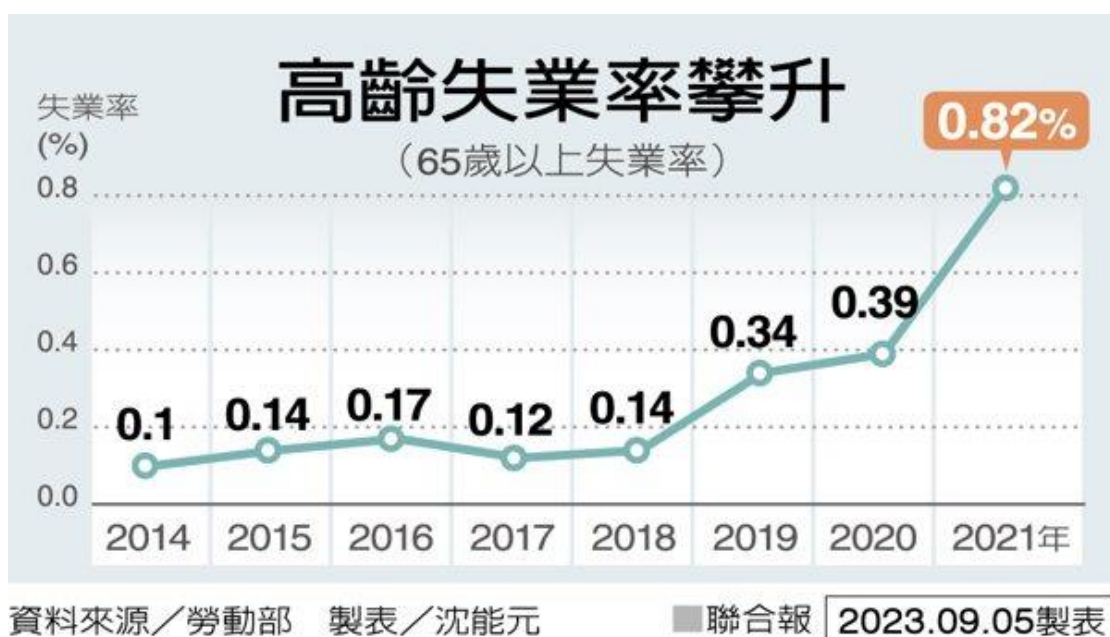
高齡失業率攀升

東海大學社工系教授呂朝賢指出，人到老年有三塊財務支柱，一是家庭支持、二是存款、三是年金等社會福利制度，過去長輩依賴家庭，但因少子化社會，未來世代的家庭支持愈來愈薄弱，存款和年金就會變得更為重要，「老年貧窮會愈來愈嚴峻，再也沒有養兒防老這件事」，養兒不啃老，已是萬幸。